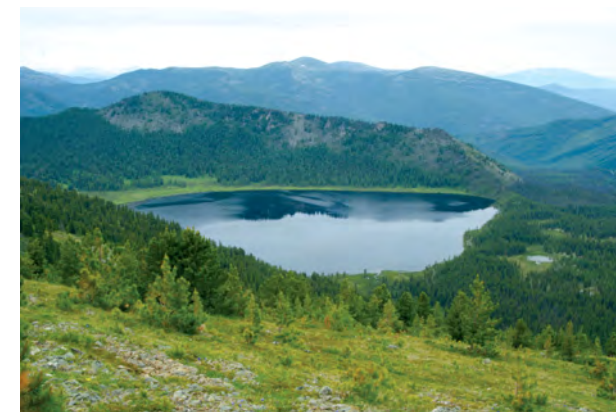
Вид на озеро Маранкуль

"Запад есть Запад, Восток есть Восток - и вместе им не сойтись" - утверждал Редьярд Киплинг. Однако в "Снежном барсе" Восток и Запад объединились. В этой уникальной природной зоне, находящейся на границе Запада и Востока, мы предложим Вам новейшие компьютерные технологии диагностики и оздо-