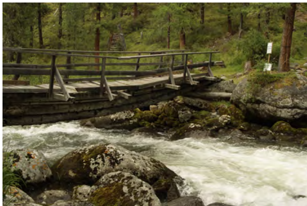
Мост через горную реку

Получив все необходимое - целебный воздух кедрового леса, чистейшую воду горных рек и озер, питание продуктами приготовленными на дровяной печи, необходимую двигательную актив-