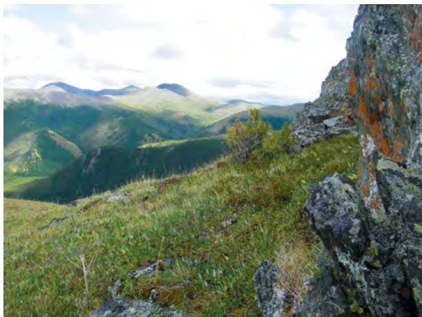
Окрестности озера Позарым