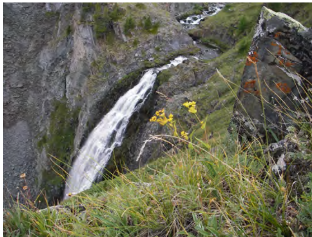
Водопад на горном ручье

ботится ваши родители. Оздоровительный комплекс "Снежный барс", расположенный в уникальном уголке Западного Саяна, не тронутым цивилизацией, в реликтовом кедровом лесу, предоставит Вам возможность почувствовать себя гармоничной частью нашей прекрасной планеты, ощутить и вобрать в себя красоту Земли. И получить все, что необходимо человеку для активного долголетия.